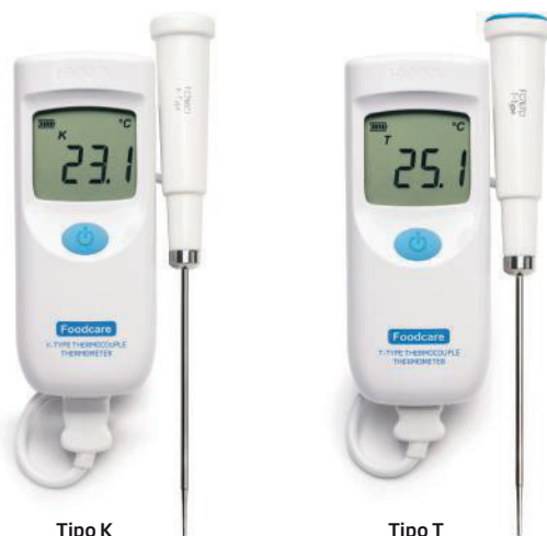
Tipo K HI935001

Los termómetros portátiles Foodcare HI935001 y HI935004 cuentan con una termocupla reemplazable (Tipo K y T, respectivamente) en acero inoxidable. Estos medidores cumplen con la normativa europea EN 13485 para productos alimenticios, función Cal Check de diagnóstico al encender el medidor e indicador de batería, apagado automático y certificación IP65. Estos termómetros ofrecen mediciones precisas en un amplio rango de temperaturas con una increíble precisión.