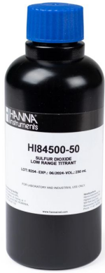
Titulante de Rango Bajo para Mini Titulador de Dióxido de Sulfuro – HI84500-50