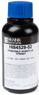
Titulante de Rango Bajo 50 para Acidez Titulable en Mini Titulador de Lácteos – HI84529-52