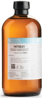
Solución de Limpieza Alcalina para Grasas (500 ml) – HI70631L