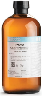
Solución de Limpieza Alcalina para Grasas (500 ml) – HI70631L