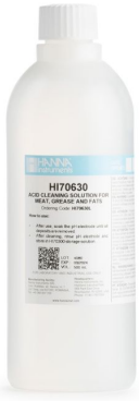
Solución de Limpieza Ácida para Grasas (500 ml) – HI70630L