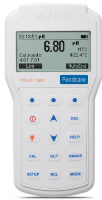
Medidor Profesional Portátil de pH para Leche – HI98162