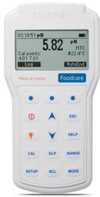
Medidor Profesional de pH para Carne – HI98163