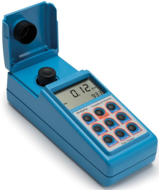
Medidor Portátil para Cloro y Turbidez (EPA) – HI93414-02