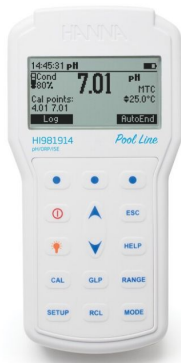
Medidor Portátil Profesional Impermeable para pH/ORP Línea Piscina