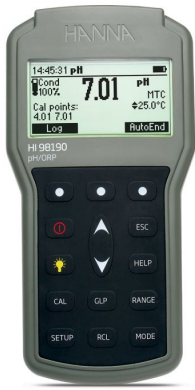
Medidor Portátil e Impermeable para pH / ORP – HI98190