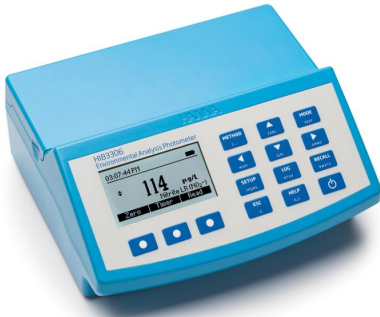
Fotómetro para Análisis Ambiental – HI83306