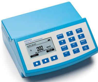
Fotómetro de Acuicultura – HI83303