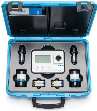
Fotómetro Portátil De Cromo (VI) De Rango Bajo Con CAL Check – HI97749-Kit