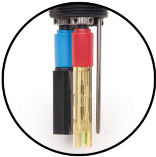
Sensores Codificados Por Colores Y Reemplazables En El Campo